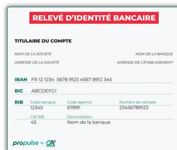
RIB de mon association