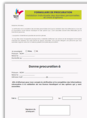
Formulaire de procuration (licencié mineur, sous tutelle, ...)