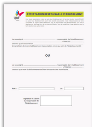
Attestation ESMS (si je suis concerné)