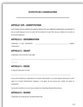
Statuts de mon association

Je suis une structure associative et je souhaite m'affilier ou me réaffilier :